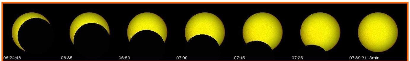
DÉROULEMENT DE L'ÉCLIPSE À N'DJAMENA – 73,2%

➤ Ce document est la propriété de SODAP-SOBOMEX et protégé par les lois internationales sur le droit d'auteur et de la protection de la propriété intellectuelle.