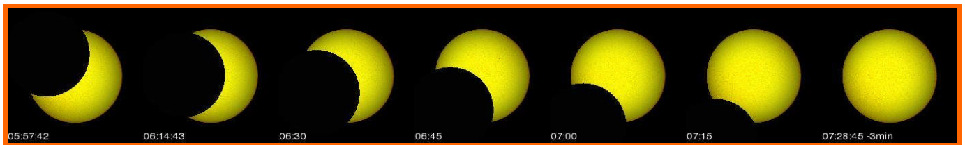
DÉROULEMENT DE L'ÉCLIPSE À KINSHASA – 54,5%

➤ Ce document est la propriété de SODAP-SOBOMEX et protégé par les lois internationales sur le droit d'auteur et de la protection de la propriété intellectuelle.