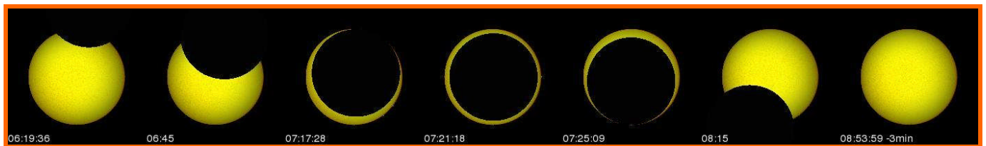
DÉROULEMENT DE L'ÉCLIPSE À ISIRO – 83,5%